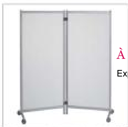
2 cloisons assemblées orientables de 0 à 360°